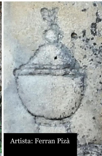
Artista: Ferran Pizà